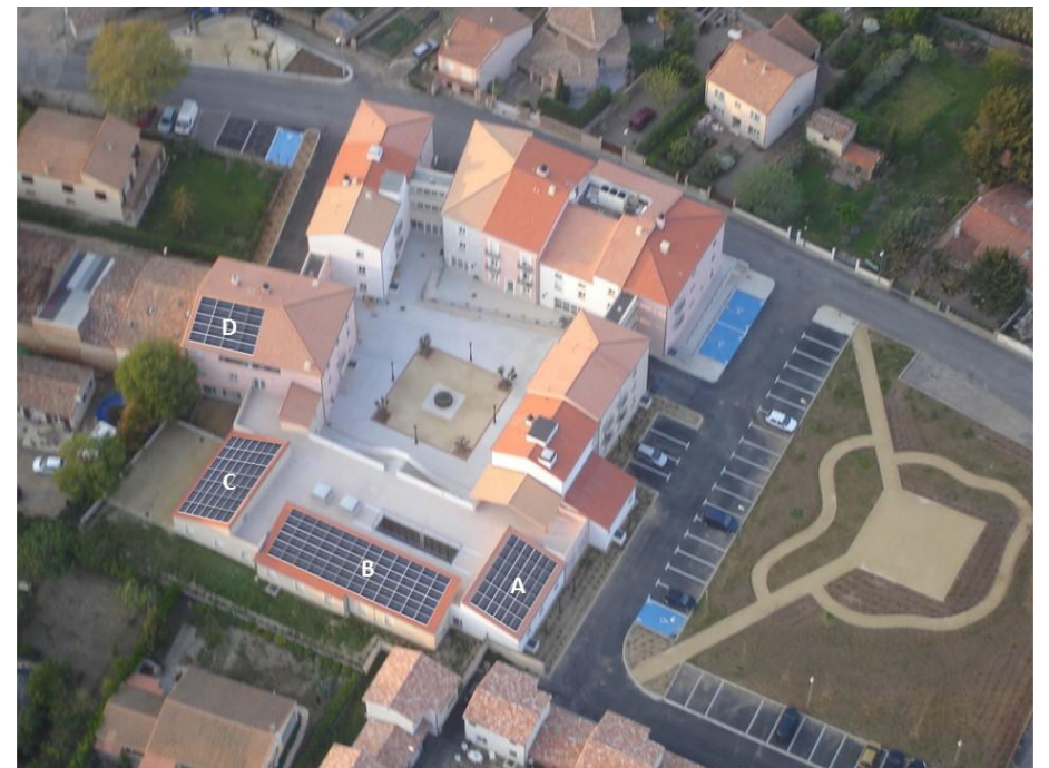
Installation PV envisagée

La maison de retraite est un ensemble immobilier composé de plusieurs bâtiments reliés entre eux par des passerelles.